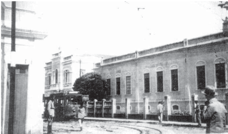
RUA DUQUE DE CAXIAS

fazendeiros detinham grande parte dos dividendos políticos. Seus ricos herdeiros, bem como jovens ambiciosos, mas menos aquinhoados de riqueza, sabendo das oportunidades em Aracaju, começaram a migrar para a cidade. Sabiam que as oportunidades de conquistar status sócio-econômico estavam nos estudos e nas formaturas dos cursos superiores. Entretanto, como ainda não existiam esses cursos em Sergipe, quem desejasse cursar Medicina ou Direito teriam necessariamente que estudar em outras cidades, sendo as mais procuradas pelos sergipanos, o Rio de Janeiro, Salvador ou Recife. Na grande maioria, a elite sergipana, assim como a brasileira da época, acreditava que os interesses privados e os públicos se intercalavam e eram incapazes de diferenciá-los. Acreditava que suas aspirações pessoais representavam o desejo da Nação: o