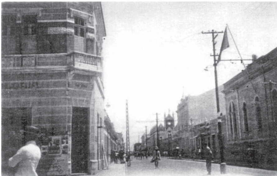
RUA DO BARÃO, ATUAL JOÃO PESSOA

Por outro lado, havia várias teorias e esforços para vencer as infecções que inviabilizam várias técnicas cirúrgicas. Dr. Charles White em 1773, preconizou a irrigação uterina com líquidos desinfetantes. Mas, foi Ignaz Semmel-