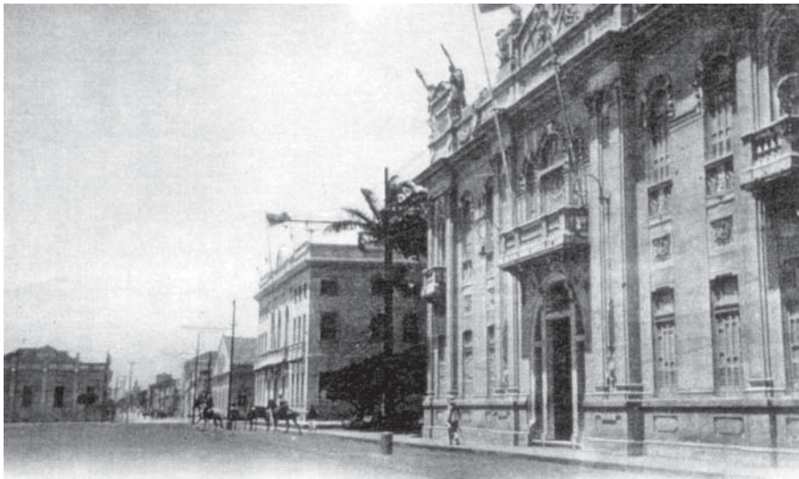
PRAÇA FAUSTO CARDOSO

tes, dos cuidados pré-operatórios, da preparação da sala cirúrgica até ao treinamento dos enfermeiros e dos auxiliares. Para operar melhor o paciente treinava em cadáveres. Nessas circunstâncias, conseguiu operar com sucesso o primeiro paciente com hérnia estrangulada em condições desfavoráveis. A primeira laparotomia executada em novembro de 1914, um fibromioma uterino, foi um acontecimento em Aracaju. Daí em diante, firmou-se como um grande cirurgião em Sergipe. Entretanto, seu grande feito, sem dúvidas, foi a criação do Hospital de Cirurgia, inaugurado em maio de 1926, motivo da sua saída em outubro do Hospital Santa Isabel. Deixou bem documentada uma grande quantidade de cirurgias entre elas mais de quatrocentas laparotomias. O Hospital de Cirurgia, ini-