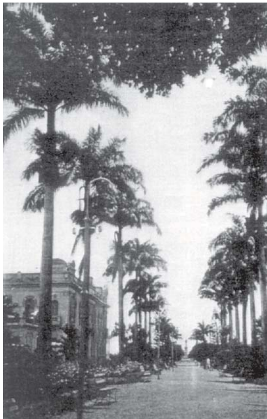
PRAÇA ALMIRANTE BARROSO

A prática da especialidade da cirurgia tinha alcançado grande desenvolvimento no início do século XX. Os métodos invasivos de tratar as doenças através de ancestrais instrumentos como estiletos, facas, bisturis, pinças e laqueaduras dos vasos sanguíneos, conhecidos como métodos cirúrgicos, eram aplicados desde o início da história conhecida da Medicina. Até a metade do século XIX, os dois grandes limitadores para o desenvolvimento da medicina eram a dor e a infecção que ocorria após a intervenção cirúrgica. Quando em 16 de outubro de 1846 na sala de operação do Hospital Geral de Massachusetts de Boston, o cirurgião Prof. Dr. John Warren operou usando éter sulfúrico ministrado pelo dentista William Thomas Green Mor-